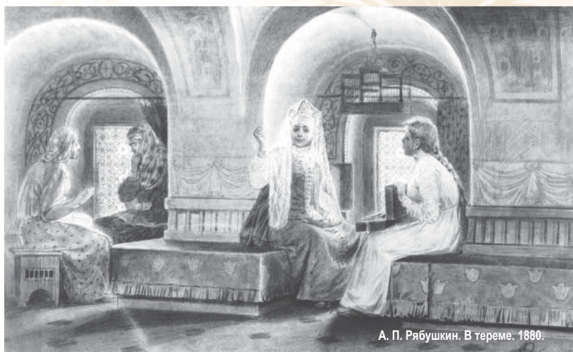
А. П. Рябушкин. В тереме. 1880.