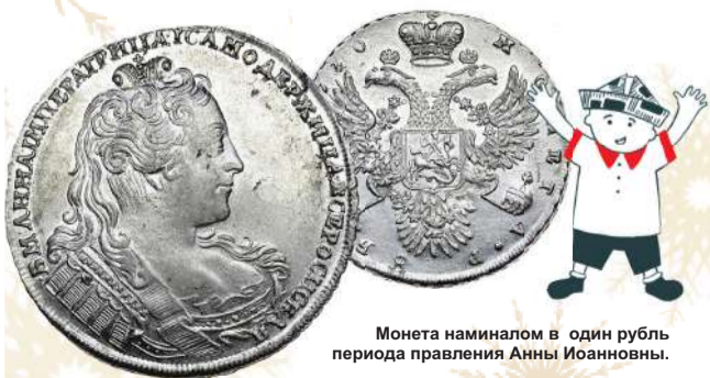
Монета номиналом в один рубль периода правления Анны Иоанновны.