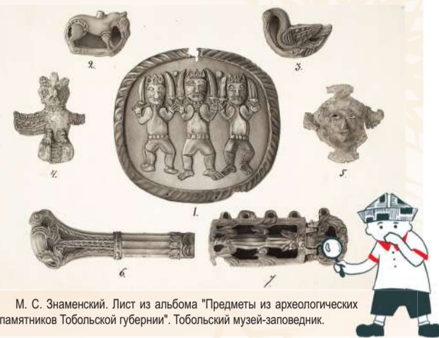
М. С. Знаменский. Лист из альбома "Предметы из археологических памятников Тобольской губернии". Тобольский музей-заповедник.

Вместе с тем можно назвать Михаила Знаменского и соавтором каталога 1890 года. Страницы издания украшают семь черно-белых фотоиллюстраций, демонстрирующих наиболее